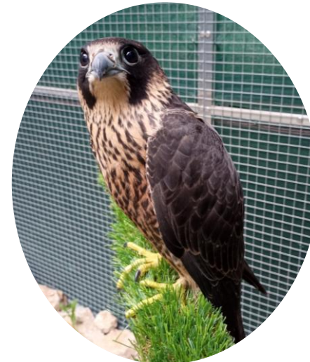
Faucon pèlerin @CSAM