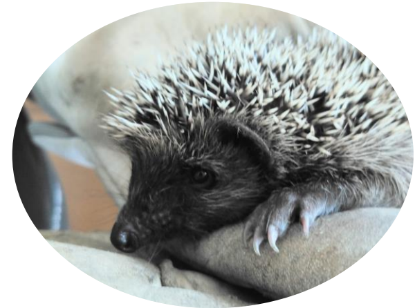
Hérisson d'Europe

53% taux de relâchers positifs pour les oiseaux