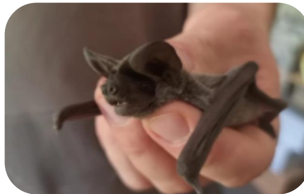
Molosse de Cestoni